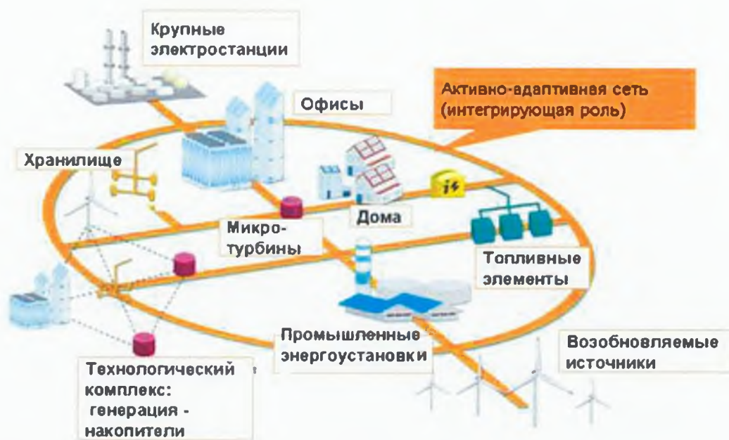
Рисунок 1 Перспективные направления развития ЕЭС РФ

Следует отметить, что криптозащита является одним из самых надежных и проверенных временем элементов в комплексе мероприятий по обеспечению информационной безопасности.